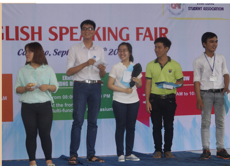
05 gương mặt xuất sắc vào vòng chung kết.

Ngày hội Nói tiếng Anh gồm các chuỗi hoạt động sôi nổi, trong đó diễn ra vòng bán kết cuộc thi thuyết trình tiếng Anh với chủ đề “ I have a dream ” với sự thi đấu của 15 thí sinh đến từ các trường và các ngành học khác nhau. Đây là cơ hội để các bạn chia sẻ những tâm tư, nguyện vọng, ước mơ, hoài bão của mình để từ đó làm động lực cho những dự định trong tương lai. Năm thí sinh xuất sắc nhất vòng Bán kết đã cùng nhau tranh tài tại vòng Chung kết diễn ra vào buổi chiều