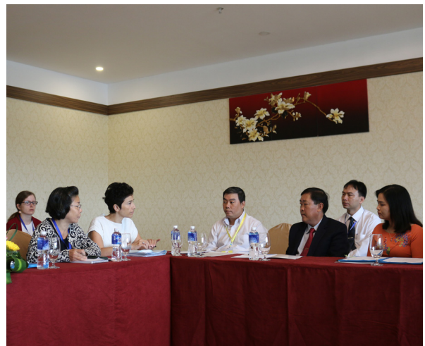
Buổi thảo luận giữa Trường ĐHCT, Bộ phận Hợp tác và Hoạt động văn hóa, Đại sứ quán Pháp tại Việt Nam và Sở Giáo dục và Đào tạo thành phố Cần Thơ về nội dung chi tiết việc thành lập Không gian Pháp.

Ngoài việc phục vụ chủ yếu cho sinh viên và giảng viên của Trường ĐHCT, các hoạt động của Không gian Pháp, cùng với sự hỗ trợ của Sở Giáo dục và Đào tạo thành phố Cần Thơ, cũng sẽ phục vụ cho toàn bộ các lớp tiếng Pháp tại Cần Thơ và vùng lân cận cũng như phục vụ cho công chúng nói tiếng Pháp nói chung.