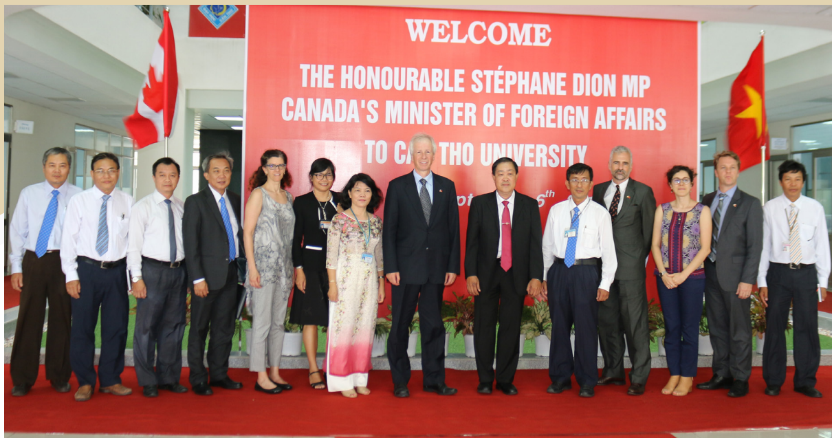
Chào đón phái đoàn Bộ Ngoại giao Canada.

P hái đoàn Bộ Ngoại giao Canada do ngài Bộ trưởng Stéphane Dion dẫn đầu đã đến thăm và làm việc với Trường ĐHCT vào ngày 06/9/2016.