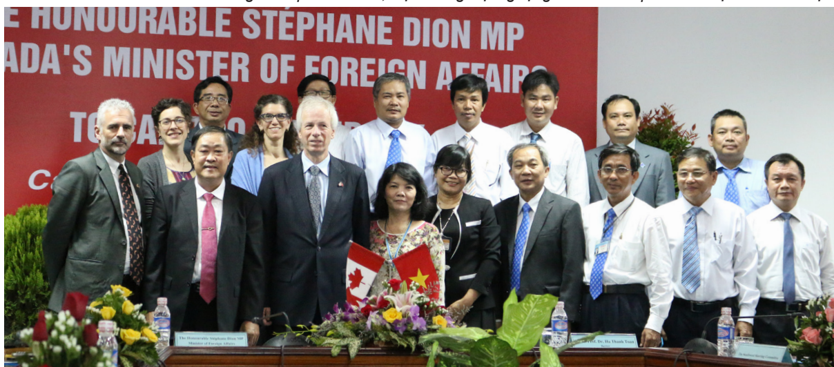
Ảnh lưu niệm tại buổi làm việc.

đến hỗ trợ trong các lĩnh vực, vấn đề liên quan đến biến đổi khí hậu, đặc biệt là các vấn đề về nguồn nước và môi trường đang diễn ra ở vùng ĐBSCL. Bộ trưởng Bộ Ngoại giao Canada, ông Stéphane Dion khẳng định “Đại học Cần Thơ là một trong những trường tốt nhất Việt Nam” và mong muốn tăng cường hơn nữa liên kết giữa Canada và Việt Nam.