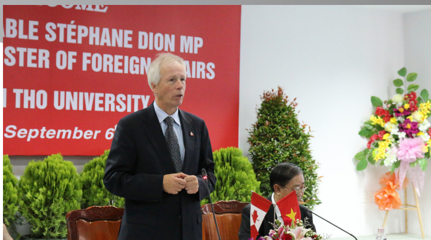
Ngài Stéphane Dion, Bộ trưởng Bộ Ngoại giao Canada phát biểu tại buổi làm việc.

trong bối cảnh diễn ra biến đổi khí hậu, phái đoàn Bộ Ngoại giao Canada đã được nghe báo cáo về “Những tác động của biến đổi khí hậu và vấn đề nước xuyên biên giới lên vùng ĐBSCL”. Trên cơ sở đó, hai bên đã cùng nhau thảo luận về tăng cường mối quan hệ hợp tác, trong đó chú trọng