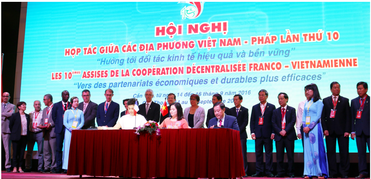
Lễ Ký kết hợp tác giữa Trường ĐHCT, Đại sứ quán Pháp tại Việt Nam và Sở Giáo dục và Đào tạo thành phố Cần Thơ về việc thành lập “Không gian Pháp” tại Trường ĐHCT.

Trong khuôn khổ Hội nghị Hợp tác giữa các địa phương Việt - Pháp lần thứ 10 “Hướng tới đối tác kinh tế hiệu quả và bền vững” được tổ chức tại thành phố Cần Thơ từ ngày 14 đến 16/9/2016, sáng ngày 16/9/2016, Trường Đại học Cần Thơ (ĐHCT) đã ký kết bản ghi nhớ hợp tác với Đại sứ quán Pháp tại Việt Nam và Sở Giáo dục và Đào tạo thành phố Cần Thơ về việc thành lập “Không gian Pháp” tại Trường ĐHCT.