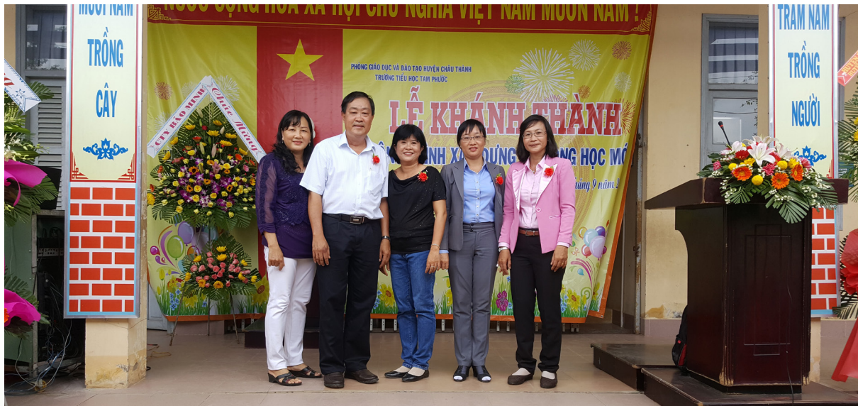
Ảnh lưu niệm của đại diện hai đơn vị.

T rường Tiểu học Tam Phước thuộc xã Tam Phước, huyện Châu Thành, tỉnh Bến Tre được xây dựng và đưa vào sử dụng năm 2009; hiện nay Trường có 2 điểm trường là điểm chính và điểm Ấp với quy mô 21 phòng học và 12 phòng chức năng. Do nhu cầu học tập của học sinh trong địa bàn ngày càng tăng, trong năm học này nhà trường còn thiếu 05 phòng học và một số trang thiết bị phục vụ cho giảng dạy.