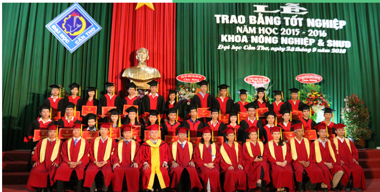
Các tân khoa chụp ảnh lưu niệm cùng các lãnh đạo và quý thầy, cô giảng viên.