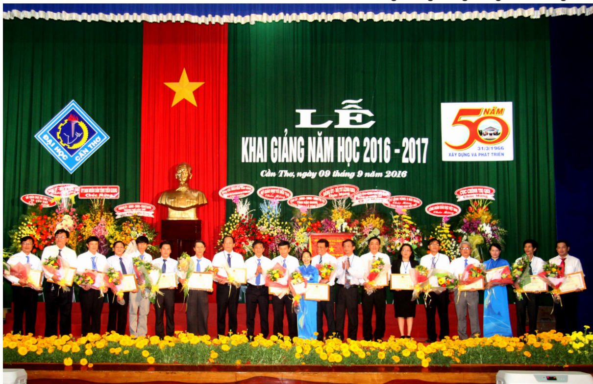
18 tập thể lao động xuất sắc và 05 chiến sĩ thi đua cấp Bộ nhận khen thưởng.

Để tiếp tục thực hiện sứ mệnh, vai trò của mình, tập thể thầy, cô giáo, công chức, viên chức và sinh viên của Trường ĐHCT sẽ không ngừng phấn đấu xây dựng Nhà trường ngày càng vững mạnh với những bước đổi mới và phát triển tốt hơn, nhanh hơn về mọi mặt, xứng đáng là đơn vị Anh hùng Lao động trong thời kỳ đổi mới, xứng đáng với sự quan tâm của lãnh đạo Đảng, Chính quyền các cấp và lòng mong mỏi của nhân dân vùng Đồng bằng sông Cửu Long.