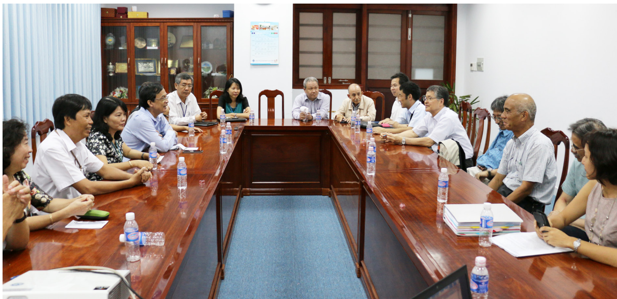
Buổi làm việc với Đoàn Giáo sư Nhật Bản ngày 31/8/2016.

Nối tiếp các chuỗi hoạt động đã thực hiện về lĩnh vực nông nghiệp (từ 27/6 đến 30/6/2016) và lĩnh vực môi trường (từ 25/7 đến 28/7/2016), từ ngày 29/8/2016