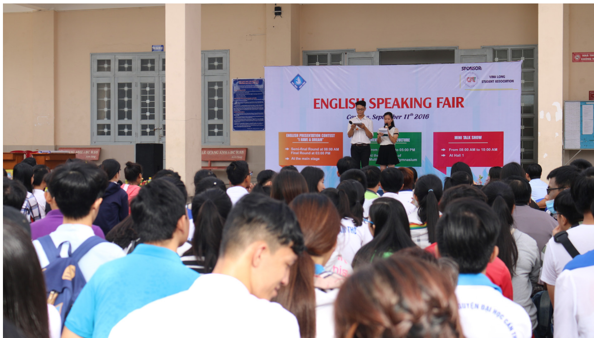
Nhiều sinh viên quan tâm đến tham dự Ngày hội Nói tiếng Anh.

Ngày 11/9/2016, tại Sân Nhà Thi đấu, Trường Đại học Cần Thơ (ĐHCT), Hội Sinh viên Trường phối hợp Câu lạc bộ tiếng Anh Đoàn trường tổ chức Ngày hội Nói tiếng Anh năm 2016 với mục đích khuyến khích tinh thần học tập sử dụng tiếng Anh trong giao tiếp hằng ngày, tạo môi trường để các bạn sinh viên thực hành, giao lưu, học hỏi lẫn nhau để trau dồi thêm kỹ năng và vốn tiếng Anh.