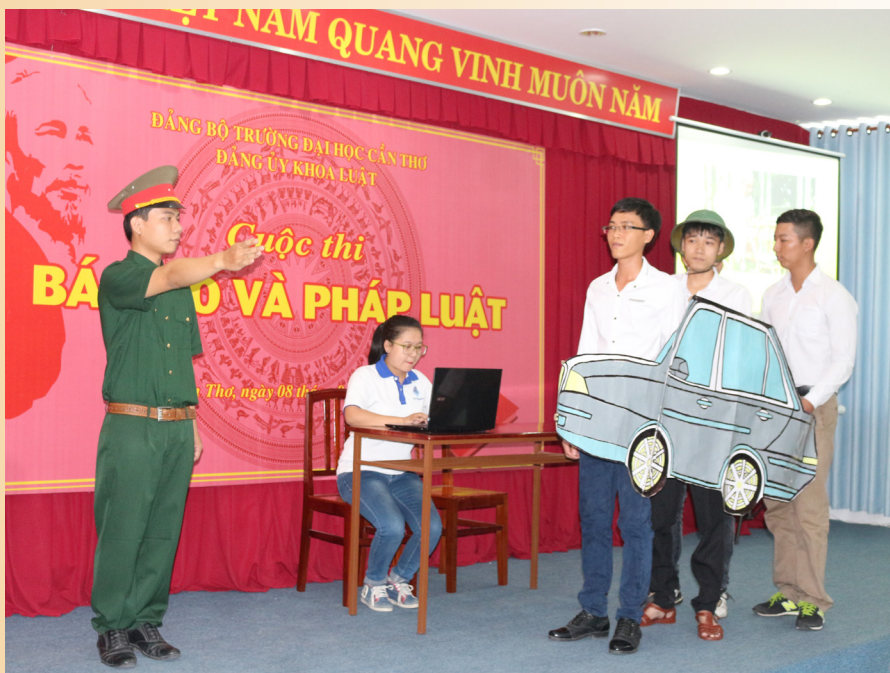
Phần dự thi của Thí sinh.

Kết thúc hội thi, Ban tổ chức đã trao 01 giải nhất, 01 giải nhì, 02 giải ba và 03 giải khuyến khích cho các đội xuất sắc nhất.