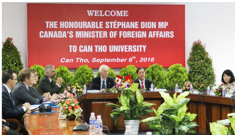
Buổi làm việc giữa phái đoàn Bộ Ngoại giao Canada và Trường ĐHCT.

Cũng tại buổi làm việc, với mong muốn tìm hiểu những thách thức về quản lý nguồn nước