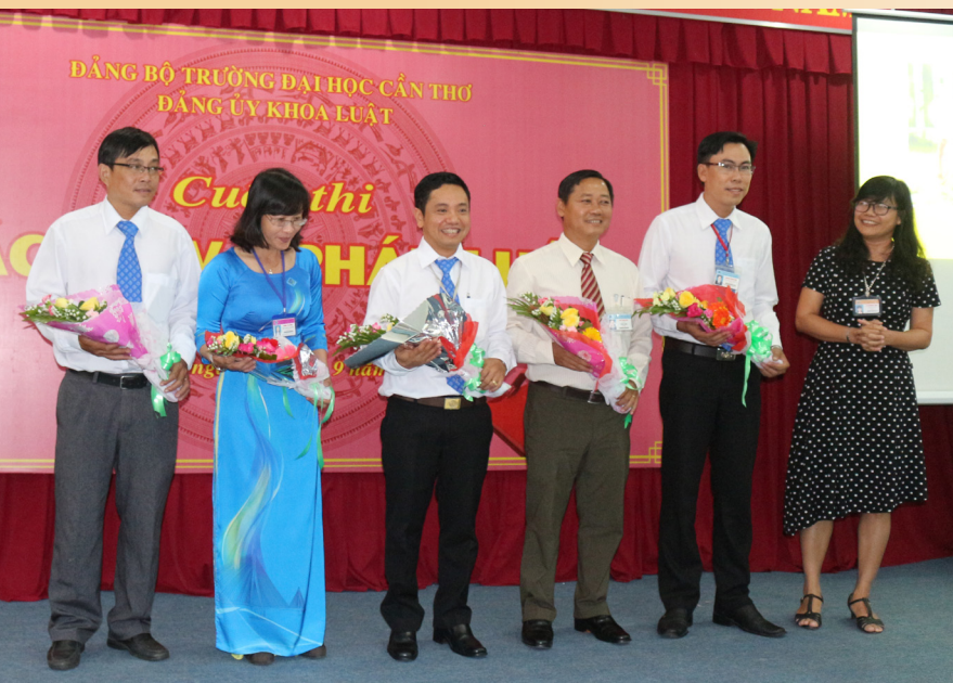
Trao hoa cho Ban giám khảo cuộc thi.

Vòng Chung kết cuộc thi Dân vận khéo với chủ đề “ Bác Hồ và pháp luật ” do Đảng Ủy Khoa Luật tổ chức đã diễn ra vào ngày 8/9/2016 trong không khí sôi nổi, tươi vui của ngày đầu năm học mới.